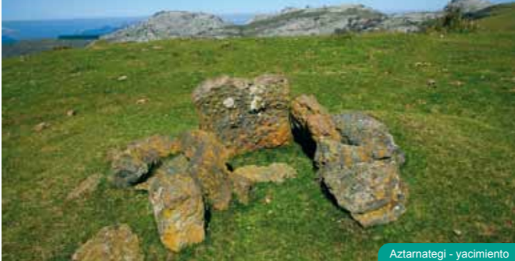
Aziamategi - yacimiento

Apta sólo para espeleólogos experimentados, esta enorme sima, cuya entrada se encuentra junto a la cumbre de Ranero (729m), alberga la mayor cavidad interior de Europa.