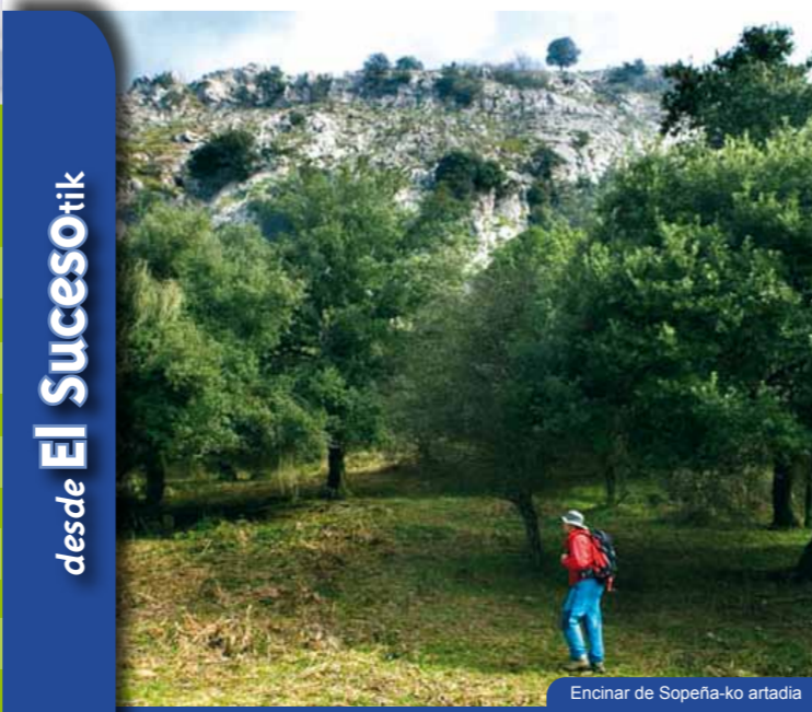
Encinar de Sopeña-ko artadia

Este hermoso conjunto rural, en el que destacan el monumento a la Virgen del Buen Suceso, el caso taurino y la iglesia, cuenta con una amplia área recreativa y una espléndida panorámica sobre el valle.