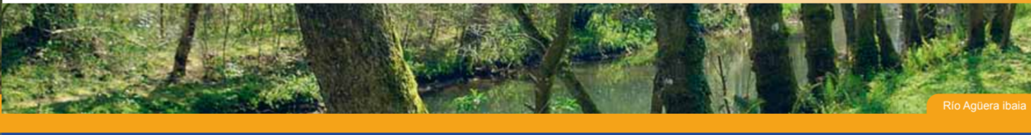
Río Agüera ibaia

Este alargado valle, jalonado de casas-torre y palacios, nos ofrece variedad de servicios y la posibilidad de dar un sencillo paseo siguiendo el río Agüera.