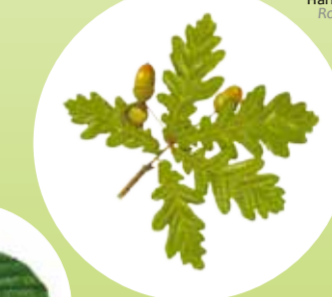
Quercus robur Haritza Roble