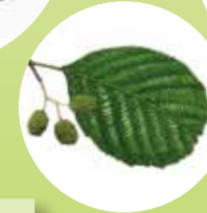
Alnus glutinosa Haitza Haizka