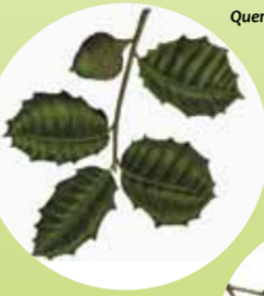
Quercus ilex Artea Encina

La intervención humana a lo largo de milenios ha generado un paisaje compuesto por un mosaico de prados, plantaciones, brezales y pequeños bosques entre los que destacan el robleal de Remendón y los encinares de Sopeña y Los Jorrios. Entre las especies de flora singular destacan Taxus baccata (tejo), Prunus lusitanica (lauré portugués) y Sempervivum vicentii (siempre viva).