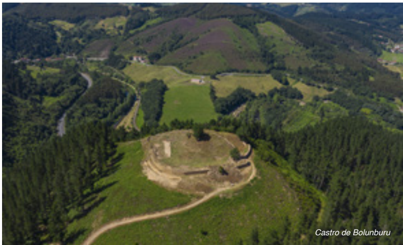
Castro de Bolunburu

En pleno centro podemos ver el palacio de Murga , sede del Ayuntamiento, que fue en sus orígenes una fortaleza defensiva transformada con los siglos en la mansión barroca que es hoy. Está rodeado de jardines repletos de árboles exóticos. En el barrio de Otxaran, no muy lejos de aquí, se encuentra el mayor viñedo de txakoli de Euskadi.