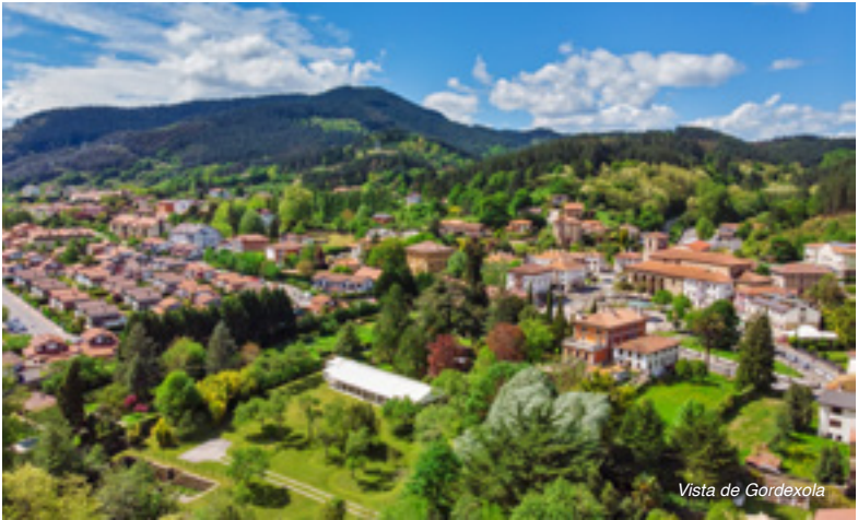
Vista de Gordexola

En la cima del Pagasarri nos toparemos con varias neveras del siglo XVII , entonces un excepcional conservante de alimentos. El hielo era tan apreciado que los lugareños imploraban las nieves en ermitas como la de San Antolín , del siglo XV .