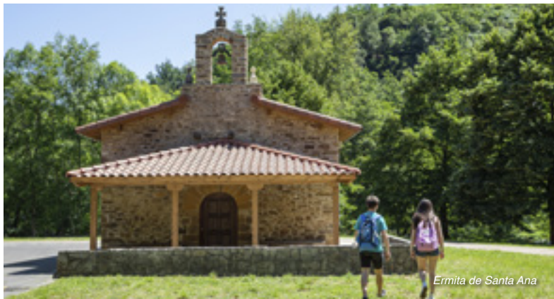
Ermita de Santa Ana

Más adelante, junto al área recreativa de Bolunburu , encontraremos otro conjunto monumental . Lo forman las ruinas de varias ferrerías y de un antiguo molino, una casa-torre y la preciosa ermita de Santa Ana, del año 1610. En sus inmediaciones, en el pico El Cerco, se esconde el mayor yacimiento arqueológico de Zalla, un castro de la Edad de Hierro (siglo IV a.C.).