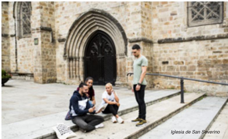
Iglesia de San Severino

A menos de 2 kilómetros del casco histórico, se encuentra la Fábrica Museo La Encartada , una planta textil del siglo XIX reconvertida en museo. La fábrica permanece en nuestros días tal cual se inauguró en 1892 . La sofisticada maquinaria original aún funciona a la perfección y, junto con la decoración de época de las estancias, nos transporta al origen de la afamada tradición textil de Enkarterri y de una de nuestras prendas más distintivas: la txapela .