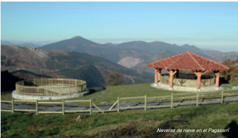
Neveras de nieve en el Pagasarri