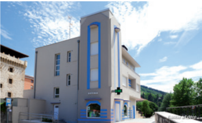
Euzkadi art déco

A su lado se alza la torre fuerte de La Puente, un edificio de piedra reconstruido en 1681 tal y como luce en la actualidad, almenado y con garitas en el piso alto. Más adelante, en el barrio de La Quadra , se nos aparecerá la imponente casa-torre del mismo nombre, con sus 20 metros de altura y una muralla exterior. Estuvo vinculada al conocido linaje de La Quadra Salcedo .