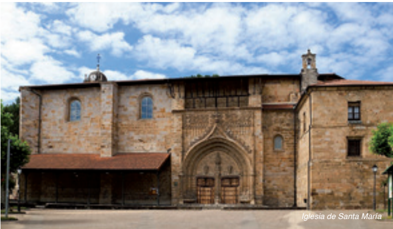
Iglesia de Santa María