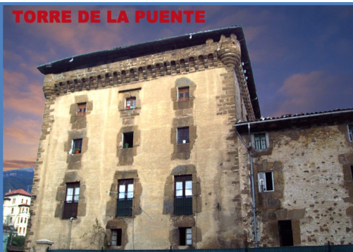
TORRE DE LA PUENTE