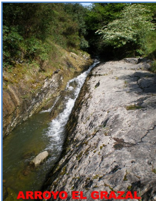
ARROYO EL GRAZAL