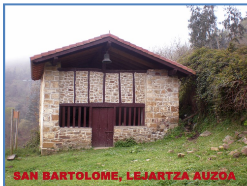
SAN BARTOLOME, LEJARTZA AUZOA