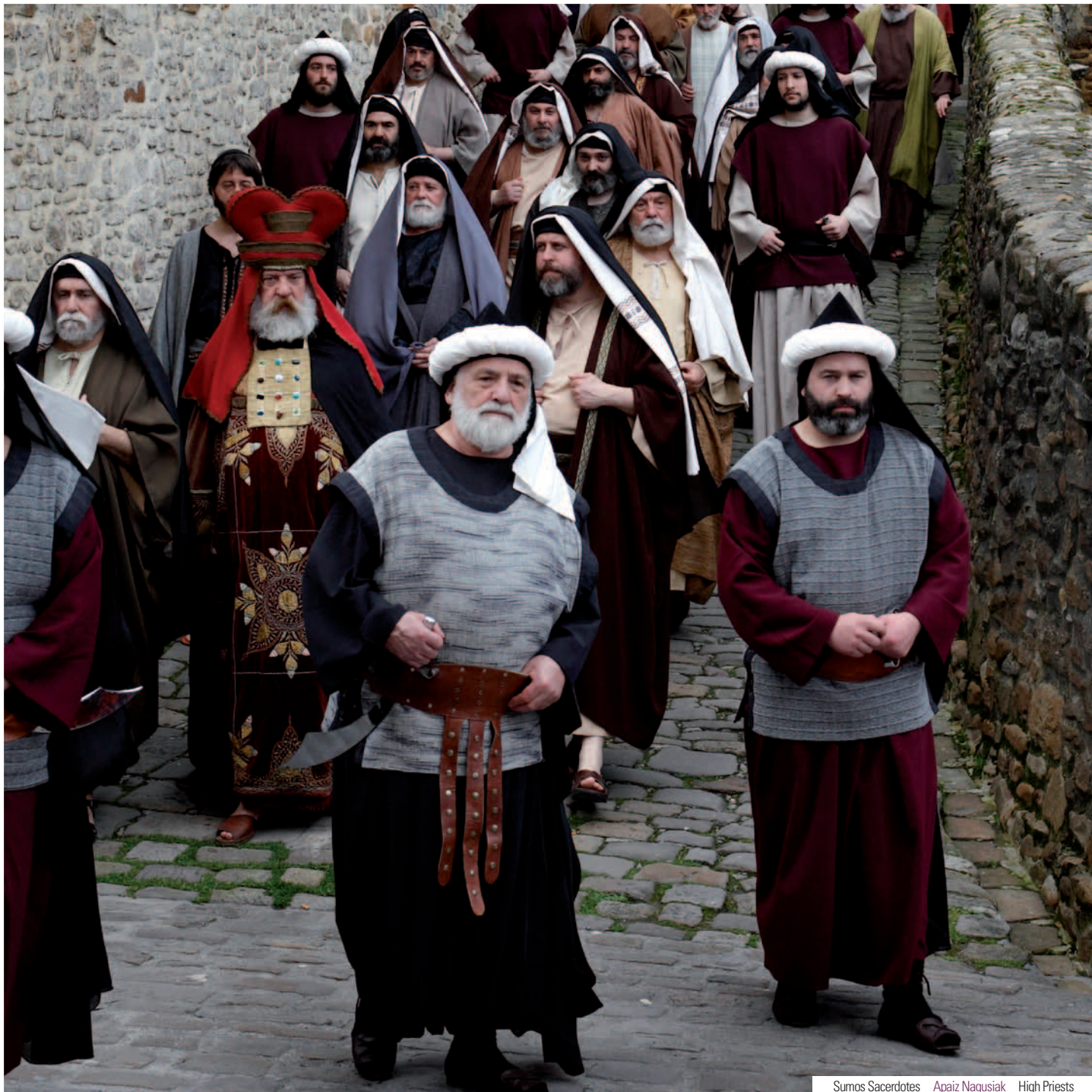
Sumos Sacerdotes Apaiz Nagusiak High Priests