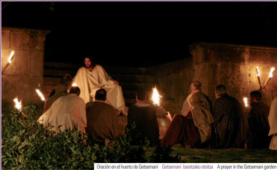
Oración en el huerto de Getsemani Getsemani baratzako otoitza A prayer in the Getsemani garden