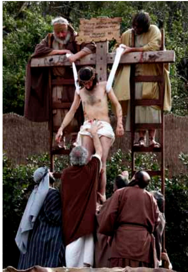
Descendimiento de la cruz Gurutzeko jaitsiera Jesus is Taken Down from the Cross

It takes place during the night of the Friday of Holy Week. This deeply traditional procession attracts many people who, escorted by the Pharisees, accompany the figures of "Christ of the Cemetery" and "The Lady of Sorrow" in total and sepulchral silence to Christ's final resting-place in hallowed ground.