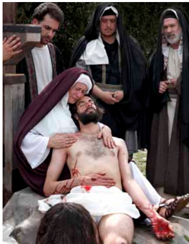
La Piedad. Jesús en brazos de su madre, Magdalena y San Juan Erukia. Jesus bere amaren besoetan, Magdalena eta San Juan La Piedad. Jesus in the arms of his mother, Mary Magdalene and St John