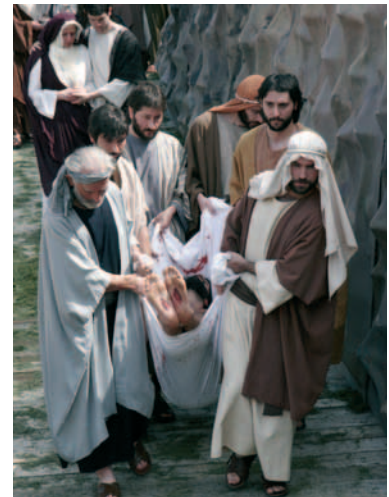
Entierro. Jesús conducido hacia el sepulcro Hobaratzea. Jesus hilibirantz eramana da The burial. Jesus is Laid in the Tomb