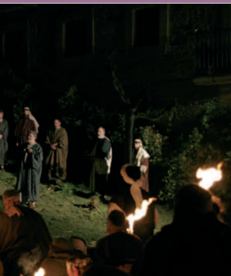
hedrin-ek burututako Jesusen txiloketa The Arresting of Jesus by Sanhedrin