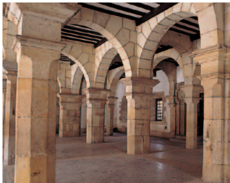
Soportales del Ayuntamiento Udalebako arkupeak The Arches of the Town Hall

Cuando en el año 1199 D. Lope Sánchez de Mena otorgaba fuero a Balmaseda estaba reconociendo desde un punto de vista legal una realidad preexistente, en la que comerciantes y artesanos daban rienda suelta a sus artes en una encrucijada de caminos entre Santander, Álava y Burgos.