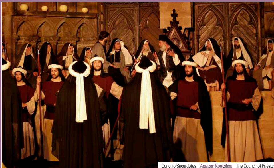
Concilio Sacerdotes Apaizen Kontzilioa The Council of Priests