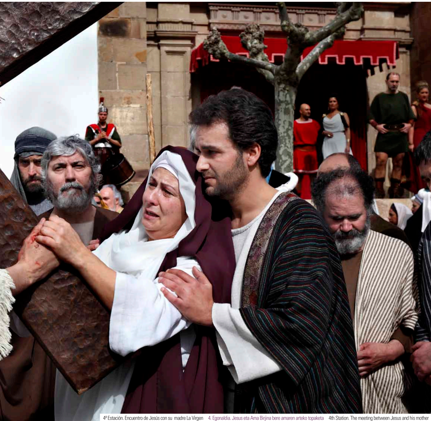
4ª Estación. Encuentro de Jesús con su madre La Virgen 4. Egonaldia. Jesus eta Ama Birjina bere amaren arteko topaketa 4th Station. The meeting between Jesus and his mother