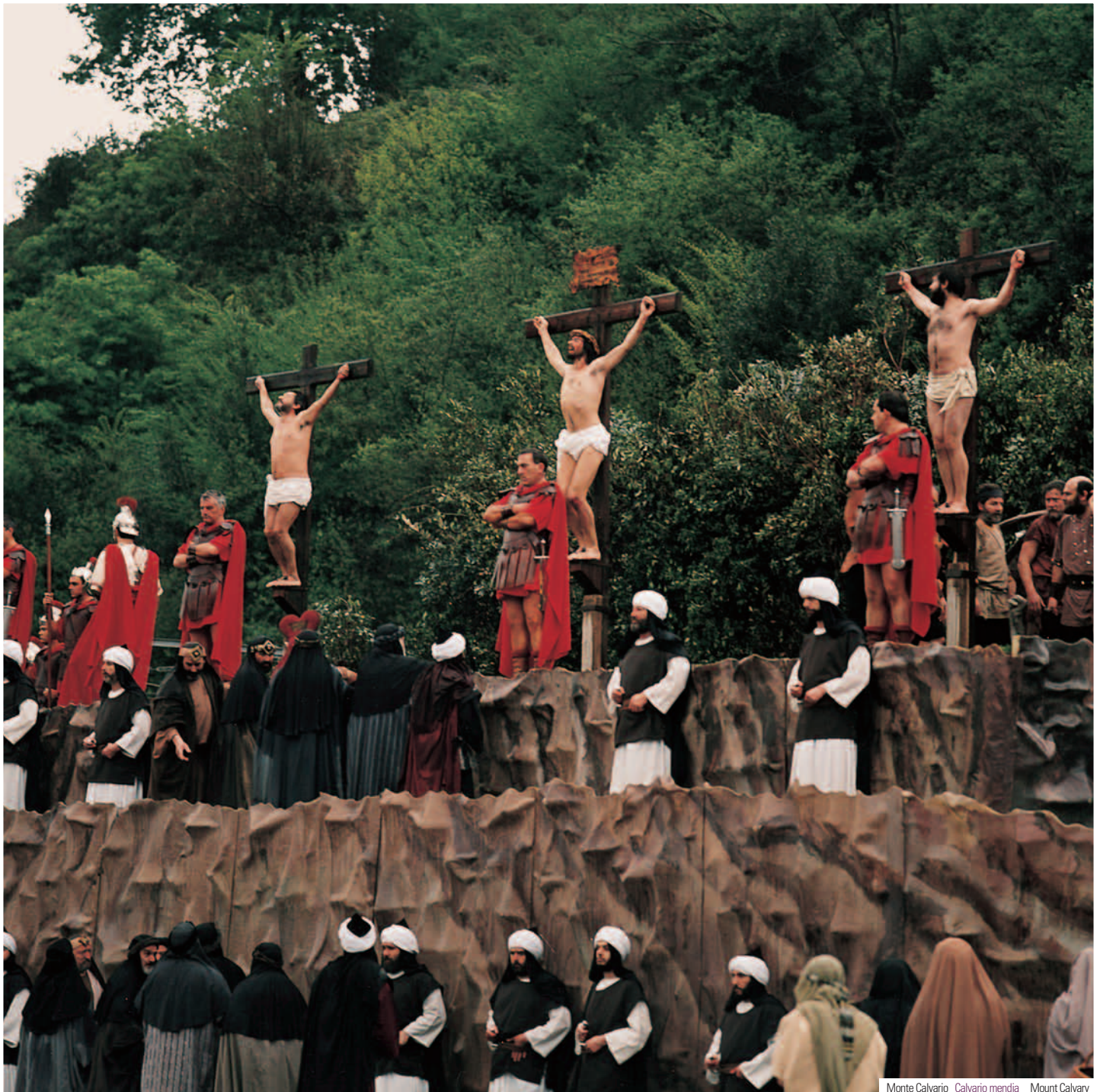
Monte Calvario Calvario mendia Mount Calvary