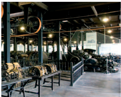
Museo Boinas La Encartada Boinas La Encartada Museoa Boinas La Encartada Museum