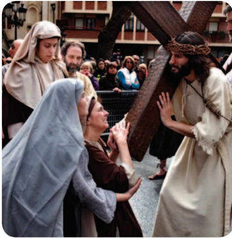
8ª Estación. Jesús con mujeres piadosas 8. Egonaldia. Jesus emakume errukiorrekin 8th Station. Jesus meets the women of Jerusalem