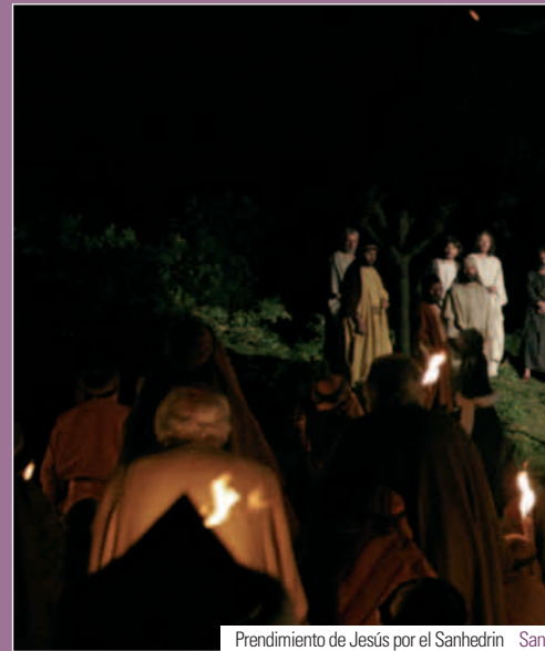
Prendimiento de Jesús por el Sanhedrin San