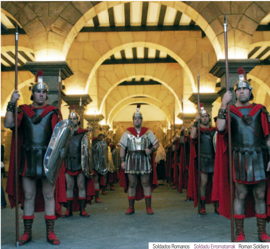
Soldados Romanos Soldadu Erromatarak Roman Soldiers