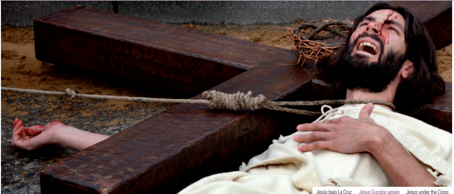
Jesús bajo La Cruz | Jesus Gurutze azpian | Jesus under the Cross