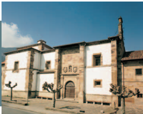
Convento Santa Clara Santa Clara Komentua Santa Clara Convent