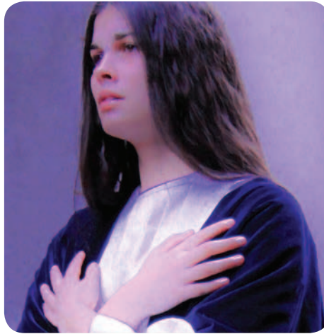
María Magdalena | Maria Magdalena | Mary Magdalene