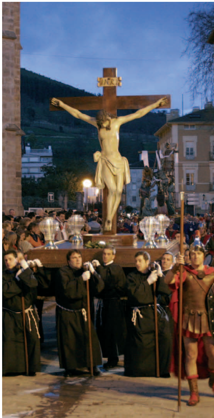
Procesión. Paso Cristo del Cementerio Prozesioa. Hilerriko Cristo Pasagunea Procession. The procession of Christ of the Cemetery