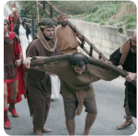
Recorrido con ladrón, sajones y Magdalena Lapur, saxoi eta Magdalenarekin eginiko ibilbidea The route with thieves, saxons and Magdalene