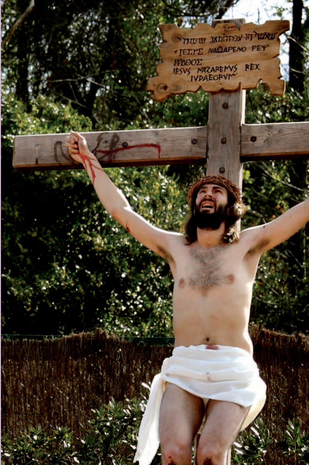
Jesús Crucificado Jesus Gurutzatua The Crucifixion of Christ